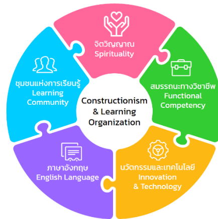
รูปแบบการพัฒนาบุคลากร Human Resource Development : HRD Model

โรงเรียนให้ความสำคัญกับการพัฒนาบุคลากรในทุกสายงาน ด้วยหลักทฤษฎี Constructionism และแนวทางการสร้างองค์กรแห่งการเรียนรู้ ขยายขีดความสามารถของตนเอง โดยได้ดำเนินโครงการต่าง ๆ เพื่อพัฒนาบุคลากรให้เป็นบุคคลที่มีคุณภาพ